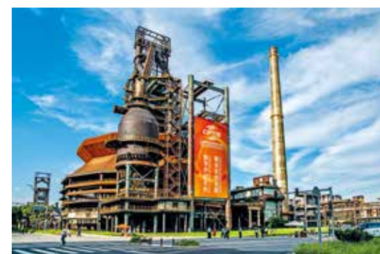
工业遗产增添风采