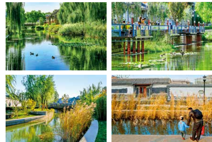
绿色项链穿城区(组照)