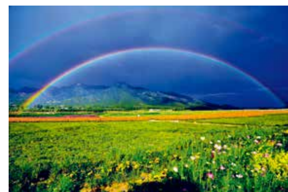
蟒山脚下—徐京波/摄(首善之都)