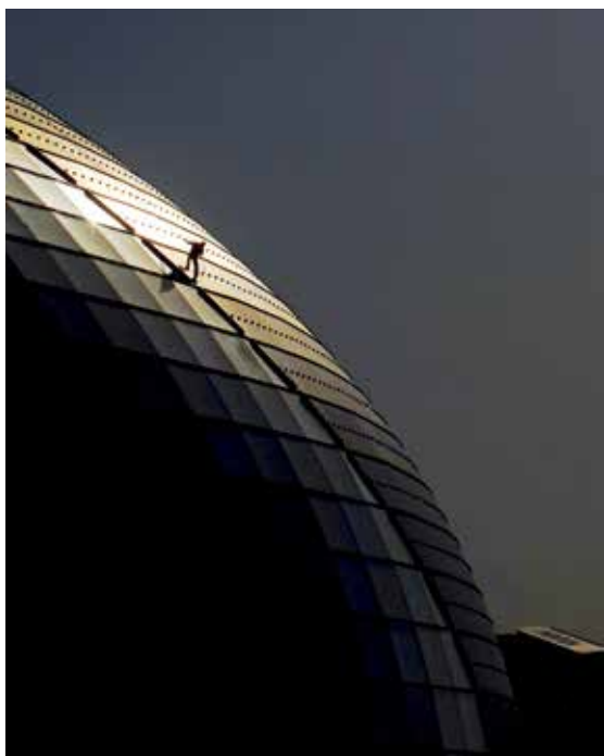
苍穹之上-闫立军/摄(和谐北京)