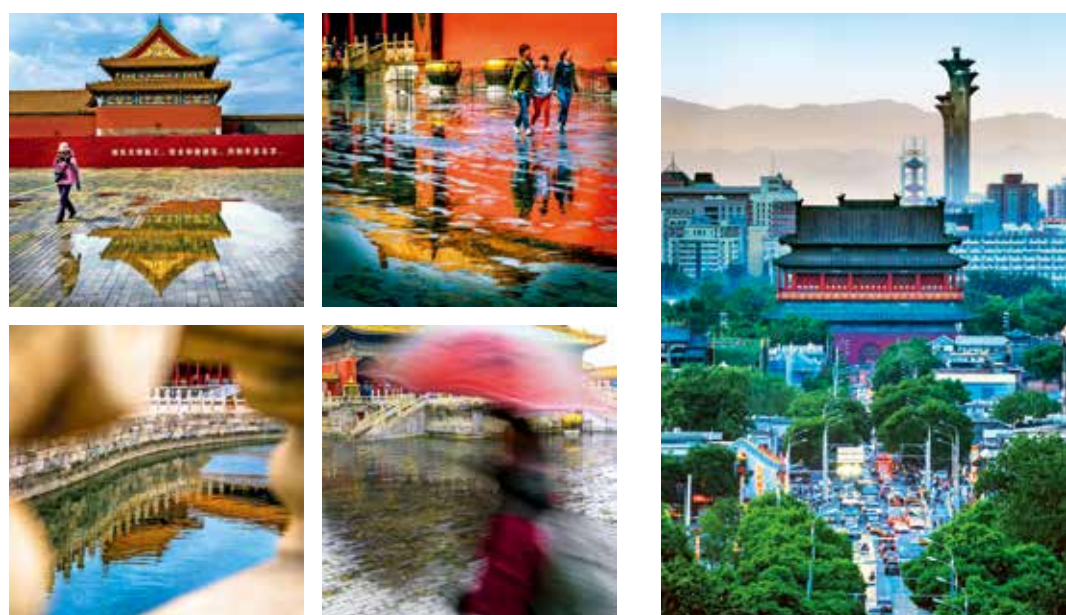
春雨春水映皇城(组照)-郑庆祥/摄(和谐北京)