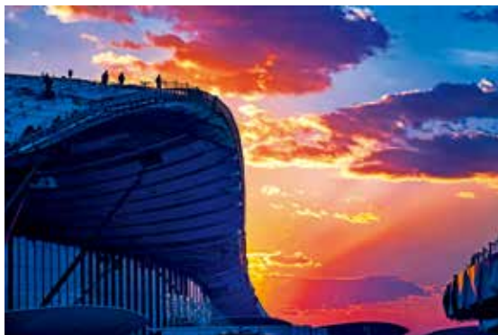
霞光下-李淑香/摄(描绘新北京)