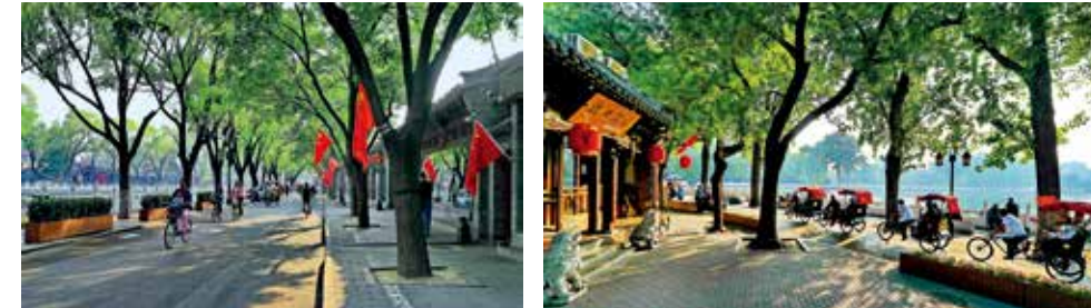
美丽街巷我的家(组照)