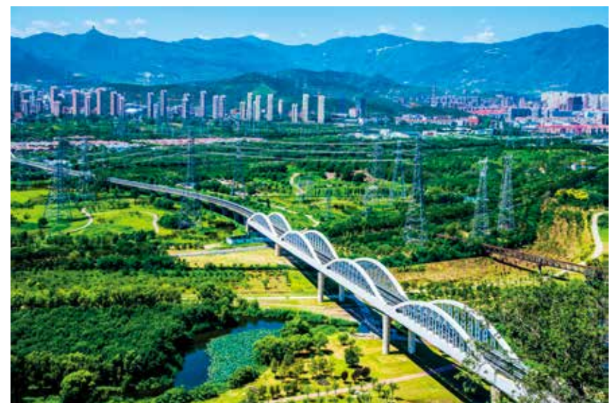
风光桥-吴福利/摄 (现代北京)