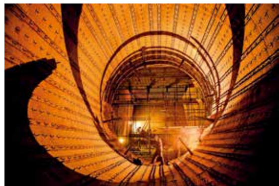
电焊光影构成(筑梦小康 幸福北京)