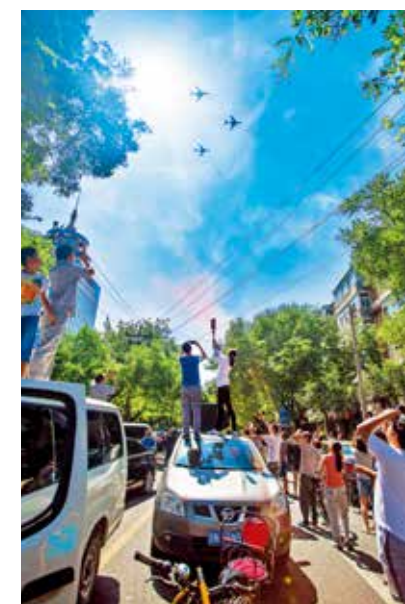
我们也来阅兵(组照)(首善之都)