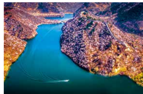
春天里的水长城—杨东/摄(描绘新北京)