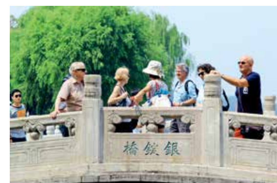
银锭桥上的游客 (首善之都)