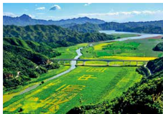
锦绣的密云大地—史振增/摄(和谐北京)