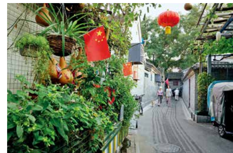
国风静巷(筑梦小康 幸福北京)