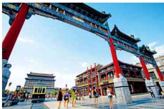
前门楼外楼