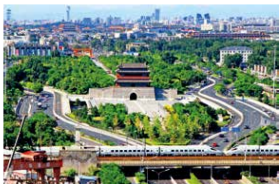
永定门的前世今生(首善之都)