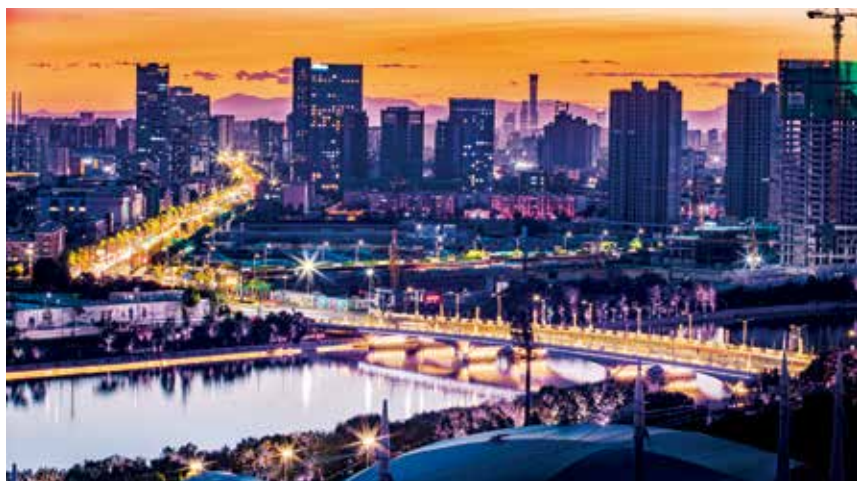
大运河之夜 (筑梦小康 幸福北京)