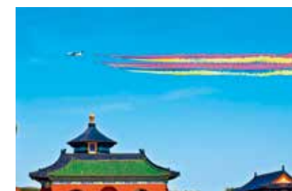
阅兵日-常立勇/摄(首善之都)