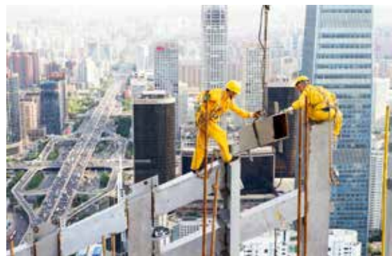
建设新北京(中国梦 百姓情)