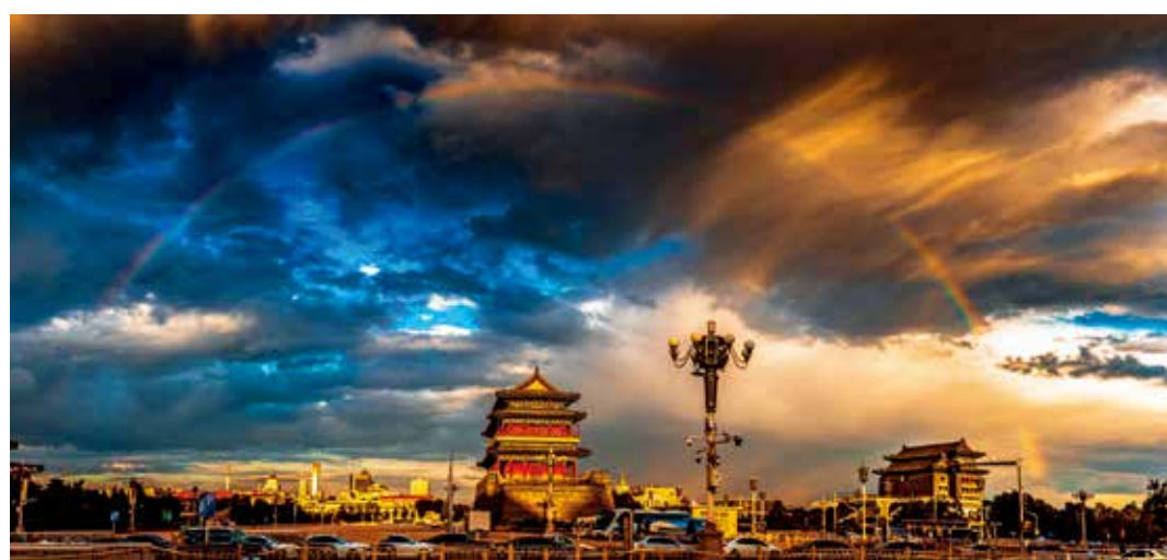
京城中轴线上架起彩虹桥(筑梦小康 幸福北京)

中轴线是北京的灵魂和脊梁,既是北京的空间之轴,更是文化之轴。在这条轴线所构建的空间里,劳动人民所创造的文化和历史熠熠生辉。随着一批重要文物、古建筑的修缮,这条文化之轴正焕发出新的生机,让我们更好地品味历史、迎接未来。