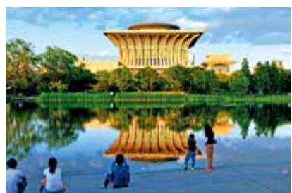
北京新景观 (筑梦小康 幸福北京)