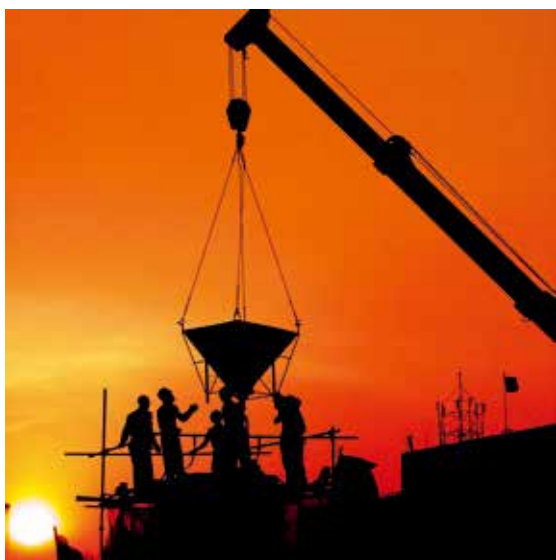
只争朝夕