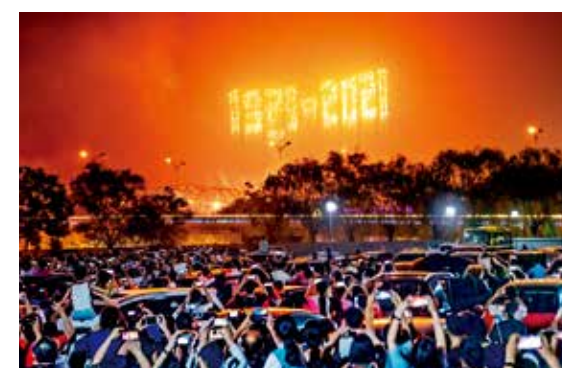
见证百年梦圆时刻(现代北京)