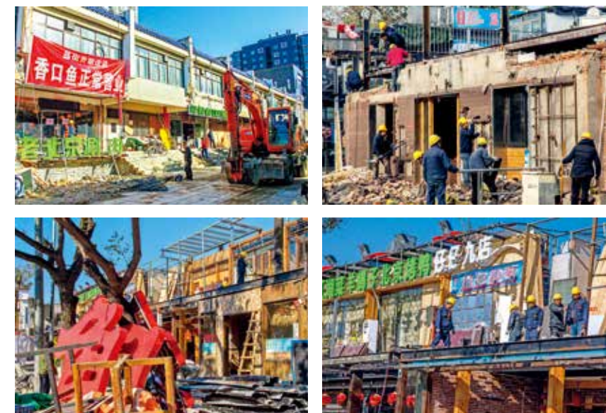
蓝街拆违建促提升(组照)—李治国/摄(北京新气象)

总体规划提供了重要支撑，北京城市精细化管理水平不断提高。其中，据统计北京有近4000条背街小巷的环境面貌得到了整体改善，实现了华丽转身。这些改造后的背街小巷有一些共同的特点，如：道路整洁畅通、无私搭乱建、无外立面破损、公共空间清朗有序、环境优美等，让首都市民有了实实在在的幸福感和获得感。部分背街小巷还被评为“最美街巷”，成为了网红打卡地。