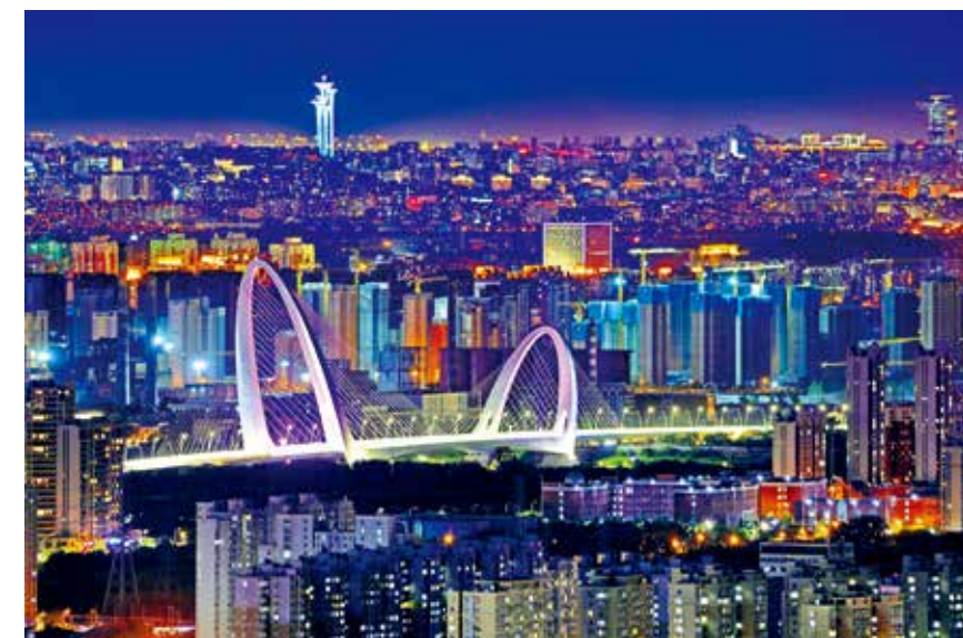
新首钢大桥夜色美-王秀丽/摄 (现代北京)