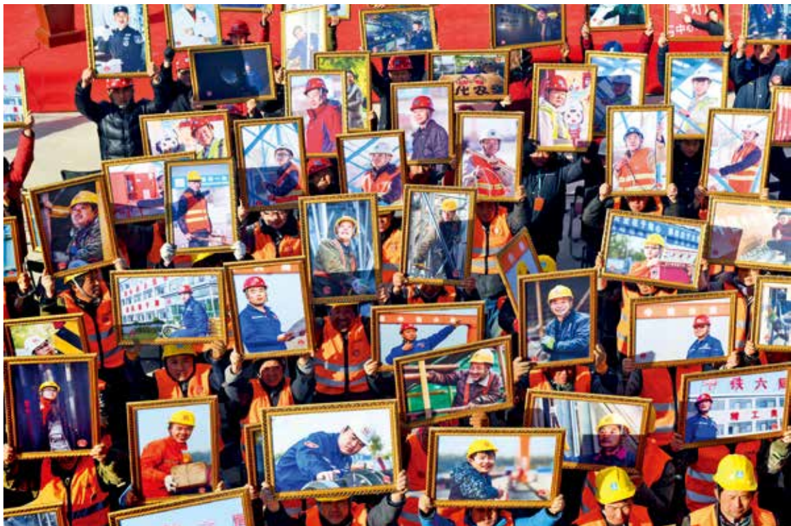
工人兄弟影像

我们是否看过他们所看过的风景 那无边的涵洞、漫天的红霞、广阔视角下的城市 机器的轰鸣是否也奏响了他们的理想 在下一个即将奔赴的远方