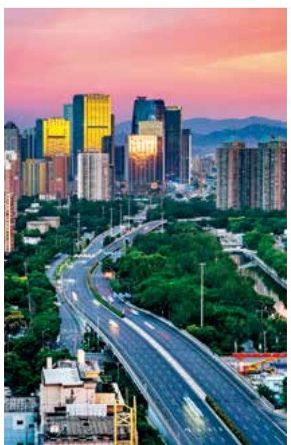
丽泽朝霞 (现代北京)

说起北京,我们常听到的两句话是“北京太大了”“北京的发展太快了”。的确,北京就是给人一种这样的印象。作为首都之城,特殊的功能定位和无与伦比的代表性,赋予了北京持续而强大的发展动能,其发展速度令世人惊叹。