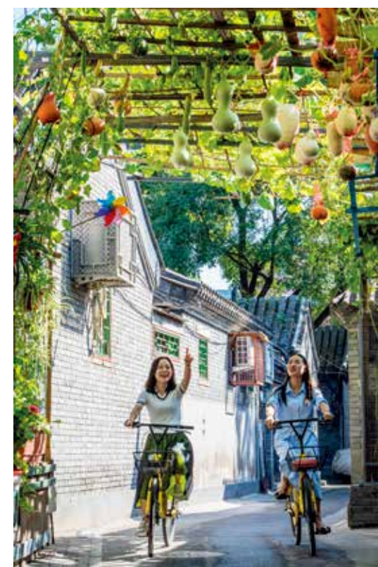
背街小巷换新颜(描绘新北京)