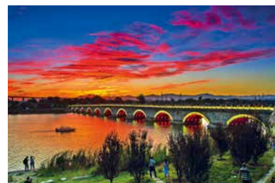
金龙披彩霞 (和谐北京)