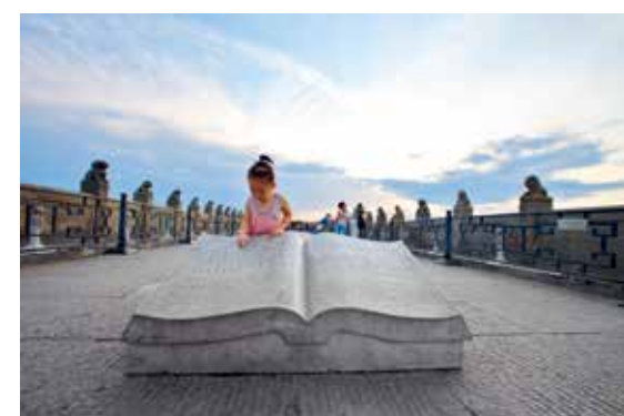
古桥上的童真 (首善之都)