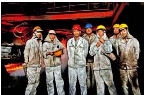
我的工厂我的家(我爱你,北京)