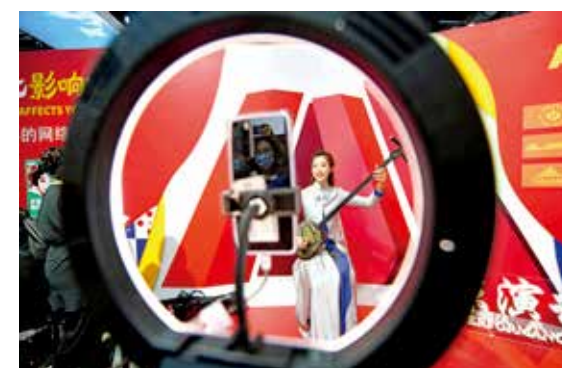
服贸会直播传统文化-和冠欣/摄(筑梦小康 幸福北京)