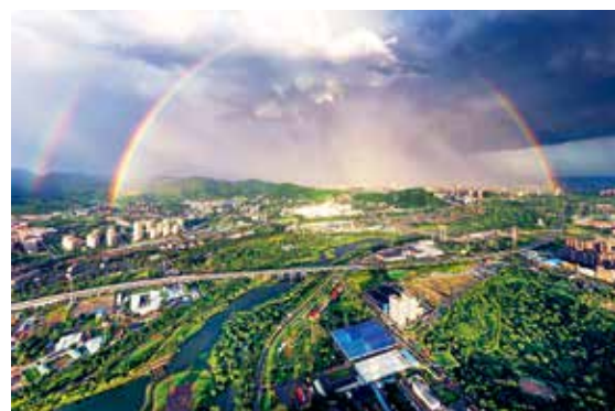
虹霓京西—高爱艳/摄(现代北京)