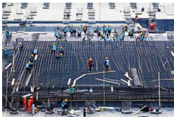
建设中的新机场(组照)