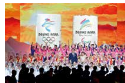
“冬奥”发布