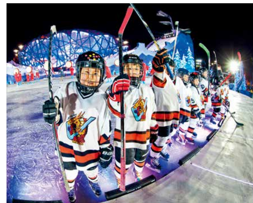
新年序曲中冬奥