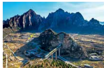
翻山越岭来看你