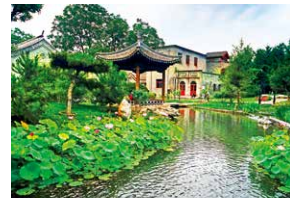
新胡同 新景观(组照)(描绘新北京)