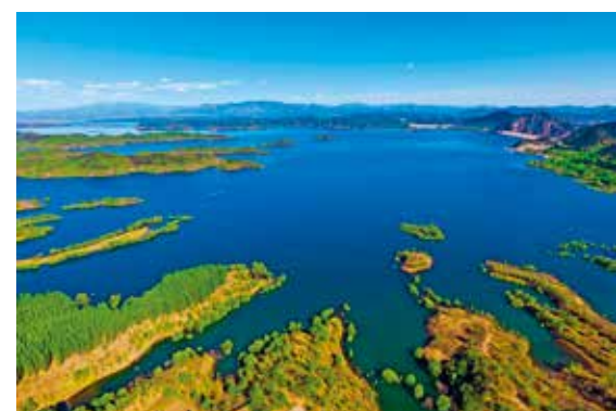
密云水库蓄水量超18亿立方米