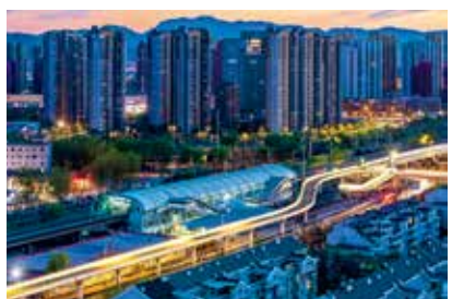
夜色龙潭站-王心超/摄 (现代北京)