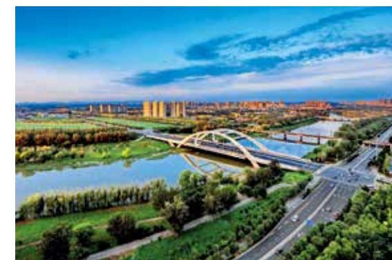
大运河畔展换新颜 (描绘新北京)