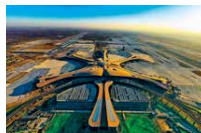
天外来客 (描绘新北京)