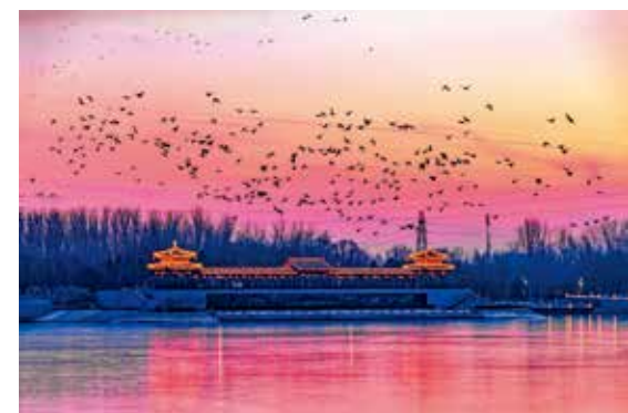
生态运河(筑梦小康 幸福北京)