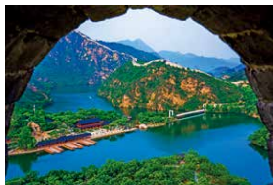
风景这边独好—赵剑琦/摄(北京新气象)