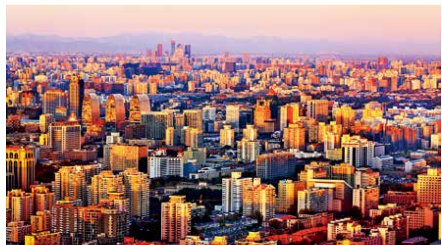
金色北京 (描绘新北京)