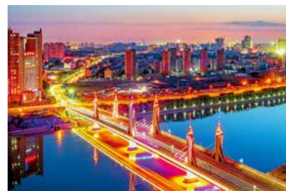
彩桥飞架运河 (首善之都)