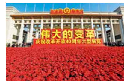
走进变革的40年(组照选)(描绘新北京)