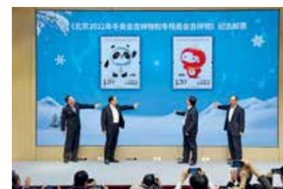
冬奥吉祥物纪念邮票首发-袁艺/摄(筑梦小康 幸福北京)