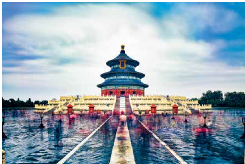
天坛风云(筑梦小康 幸福北京)

北京中轴线,是自元大都、明清北京城以来北京城市东西对称布局建筑物的一条对称轴,南起永定门,北至钟鼓楼,直线距离长约7.8公里,是古代北京城市建设最突出的成就。中国建筑大师梁思成曾赞美它是“全世界最长,也最伟大的南北中轴线”“北京独有的壮美秩序就由这条中轴的建立而产生”“气魄之雄伟就在这个南北延伸、一贯到底的规模”。