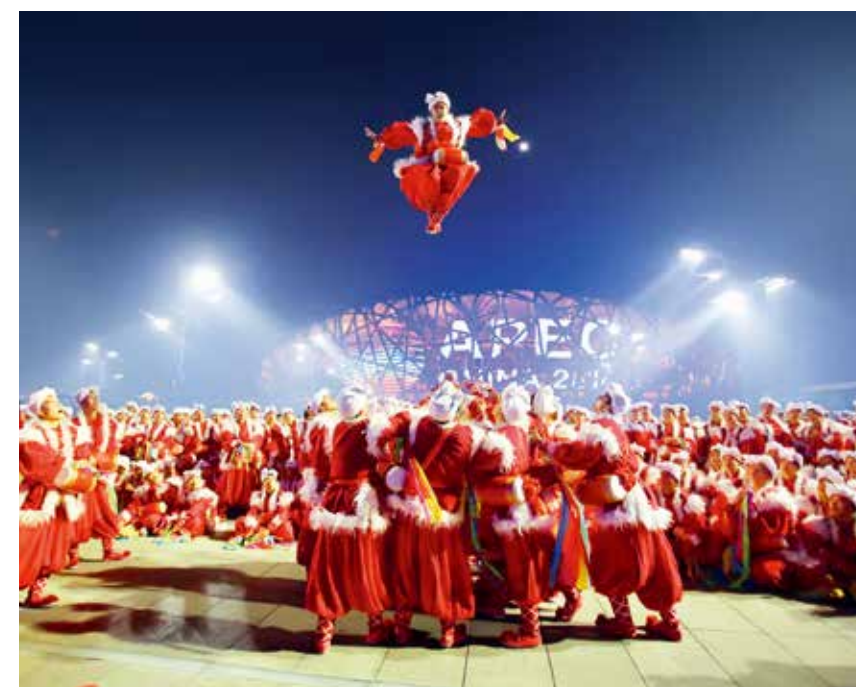
九天揽月-曲扬/摄(中国梦 百姓情)

北京城的热闹还在延续,这座从历史走来的千年古都将在新发展征程中进一步绽放她的魅力,获得更多关注的目光。