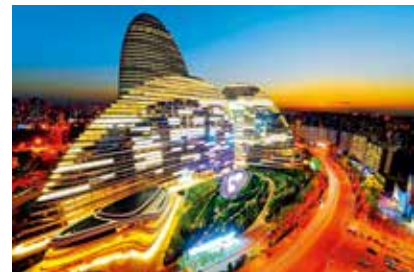
望京SOHO (中国梦 百姓情)