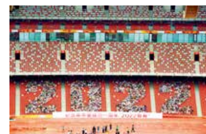
2022有我-崔峻/摄(北京新气象)