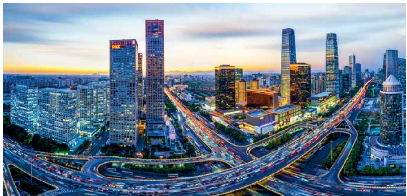
国贸桥 (筑梦小康 幸福北京)