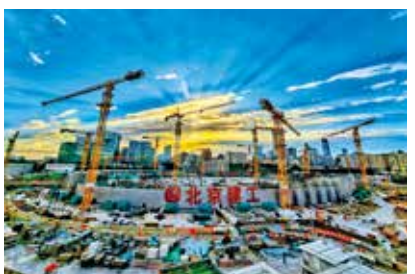
霞映东方-王建忠/摄 (现代北京)