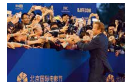
红毯开幕式-胡科/摄(首善之都)