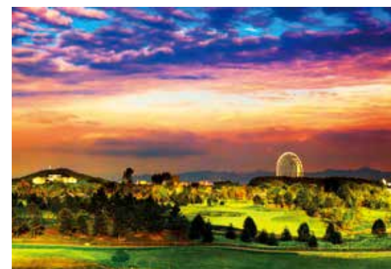
今日雁栖美如画