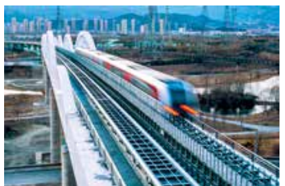
磁悬浮列车通过永定河大桥