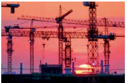
夕阳塔影 (北京新气象)

另一彰显北京飞速发展的现象,便是散落在北京城里的各大建设工程。高大的塔吊耸入云端,伴随着旭日东升和霞光万丈,鬼斧神工般地改变着城市的模样,记录着北京发展向前的步伐。