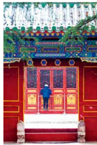
天坛斋宫在飞雪的映衬下显得别具韵味,一位游客正全神贯注地透过玻璃向里探望,更增添了古建的神秘色彩。