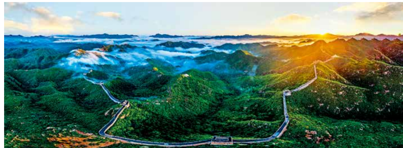
金山岭长城在霞光的普照下更加绚丽多彩,与北京日益改善的生态环境,共同谱写了京津冀协同发展的生态新篇章。