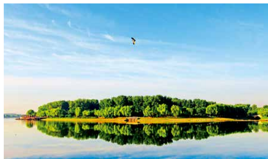
通州大运河经过环境整治后,岸青水秀,碧波荡漾,彰显古今和谐共融的历史文化魅力。图为一只水鸟飞过大运河。