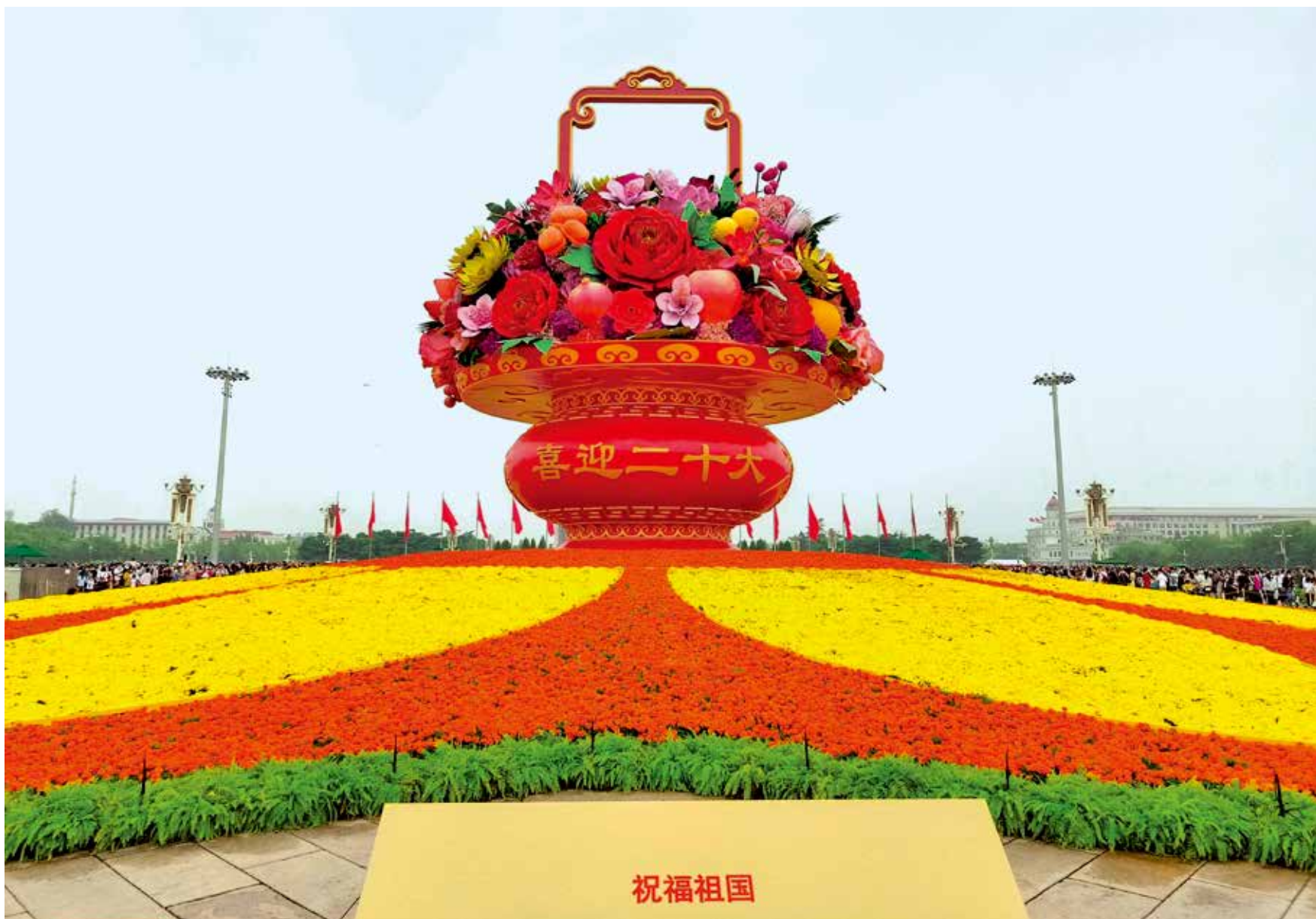
2022年10月，中国共产党第二十次全国代表大会与新中国73周年华诞喜相逢，标有“喜迎二十大”和“祝福祖国”的巨型花篮吸引广大市民和游客前往打卡。