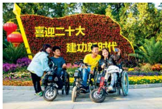
国庆节前夕,一群残疾朋友在“喜迎二十大 建功新时代”花坛前合影留念。