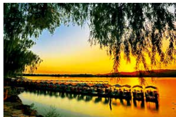
落日的余晖撒向昆明湖,湖水、游船和岸边的垂柳共同沐浴在金红的晚霞之中。