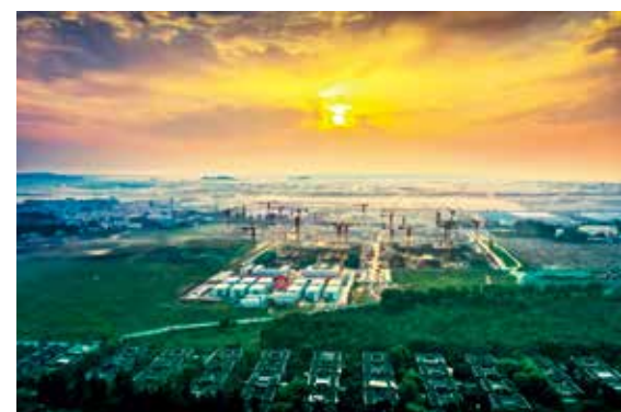
李遂柳各庄棚改工地