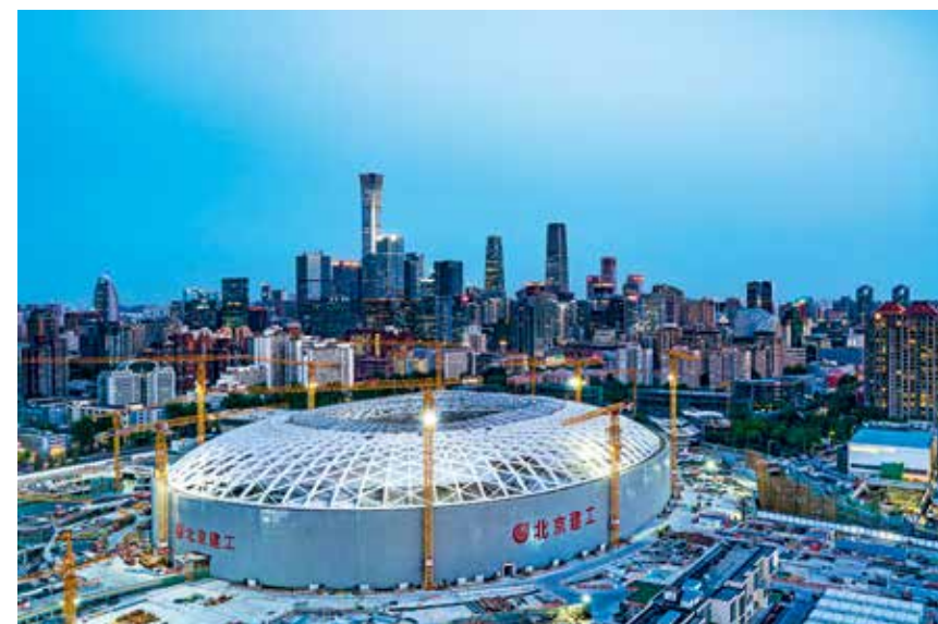
北京工人体育场在北京人的心目中有着深刻的印象。新重建的工体更加辉煌,以打造“城市地标”为目标,与CBD商业圈融为一体。