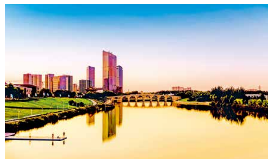
夕阳西下,大运河上的古桥、河畔的现代建筑与平静的河水交相辉映,显得格外美丽,构成了一道靓丽的风景线。