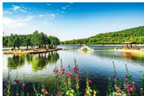
房山区一个曾经容纳燕山石化废水的小水库,如今变成了水清草绿的牛口峪湿地公园。