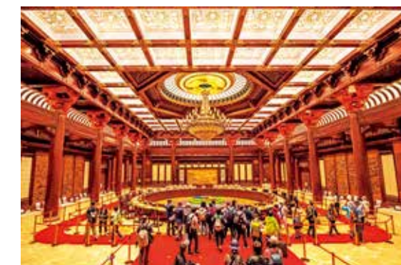
国际会议中心内景