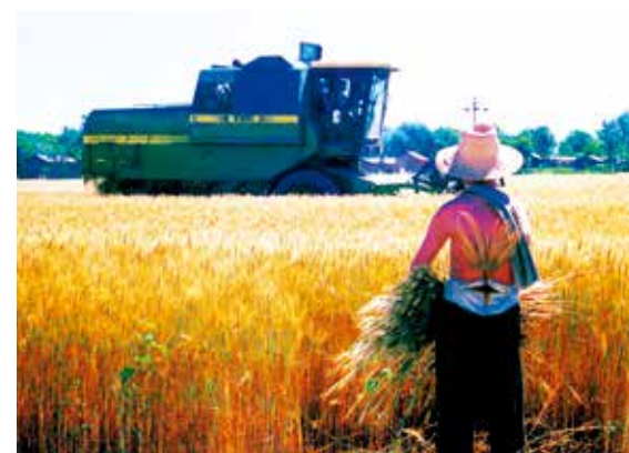
1985年沿河乡全国农业机械化试点