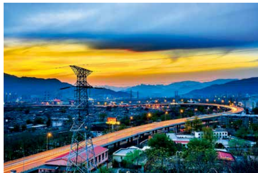
门头沟作为北京的生态涵养区,通过生态保护、综合治理等措施,努力为首都新发展守住绿色家底。