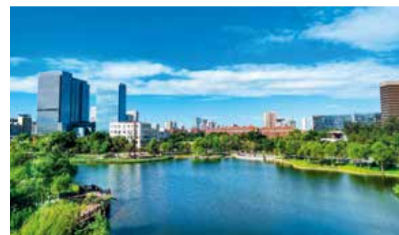
心旷神怡的西海子公园