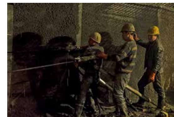
开挖班进行打孔作业