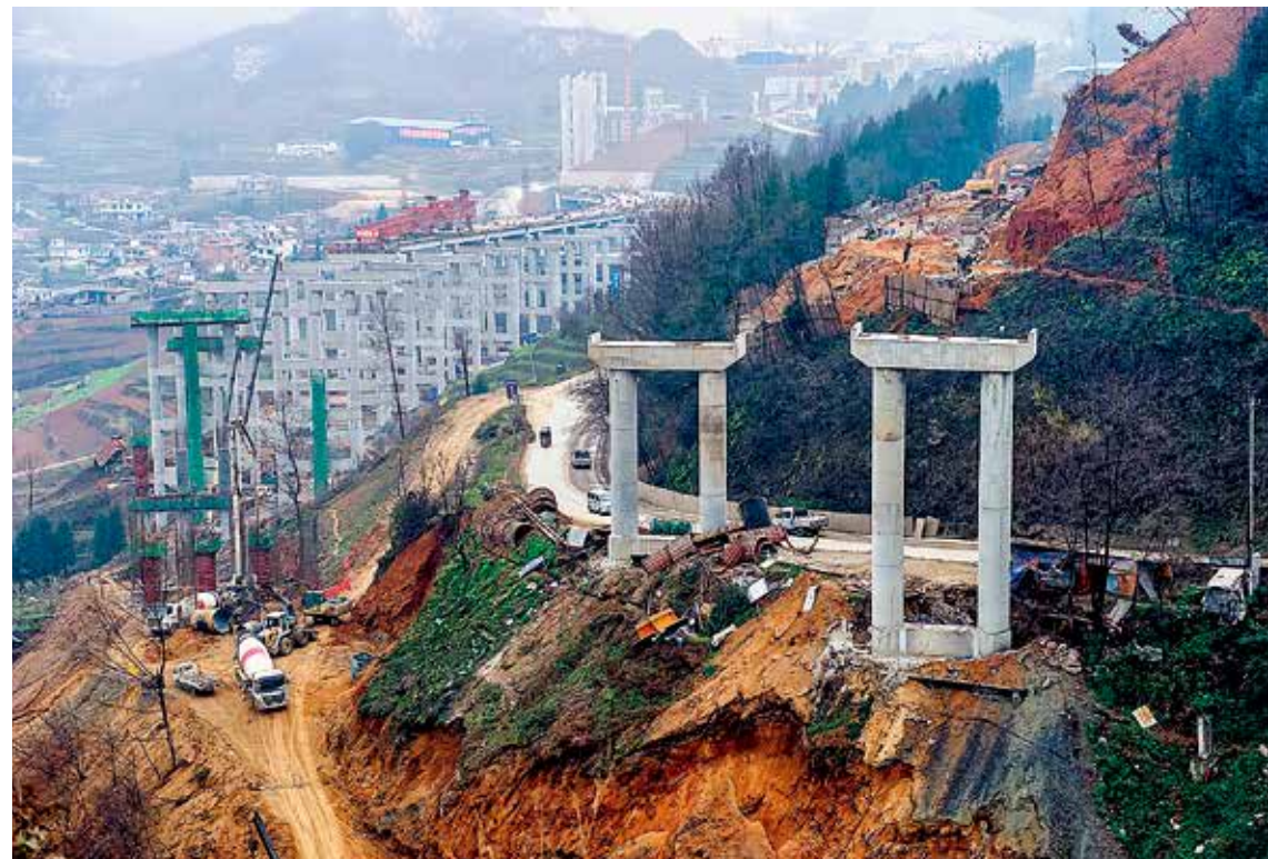
建设中的威宁高速公路贵州六盘水段