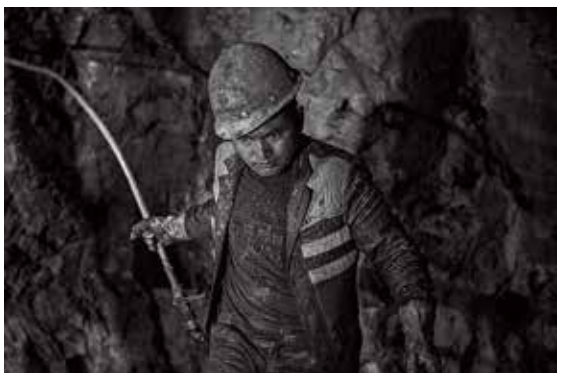
填充炸药前清理地眼中的砂砾等