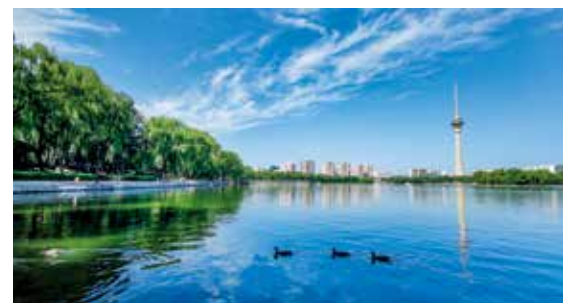
玉渊潭公园的碧波