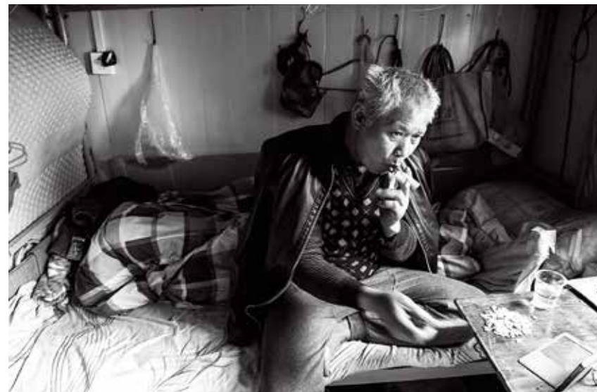
休班时，在宿舍喝点儿小酒以解思乡之愁。