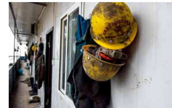
宿舍走廊里挂满了工服和安全帽