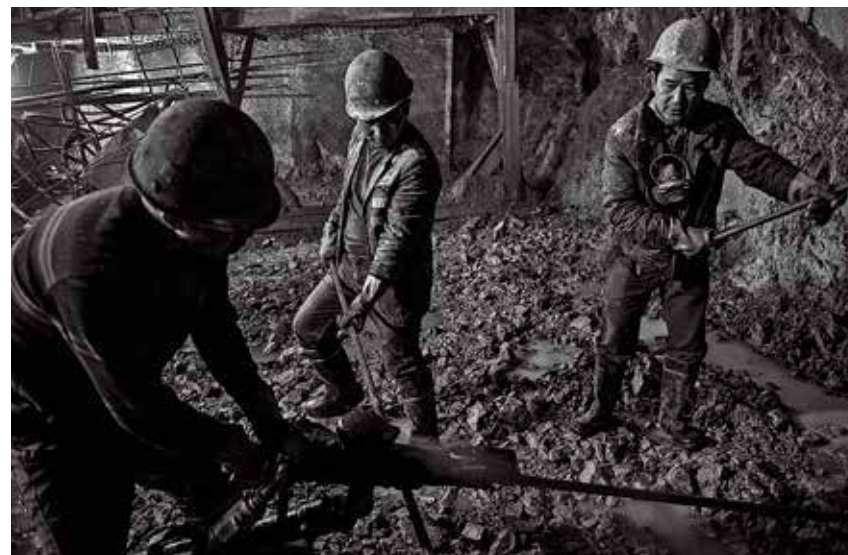
三名工人配合完成钻孔作业