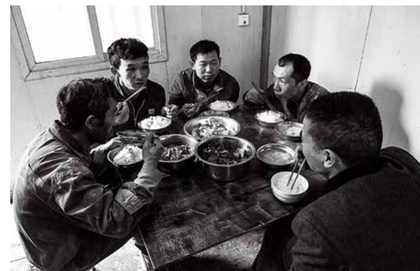
下班后，工友们聚在一起吃饭聊天，其乐融融。