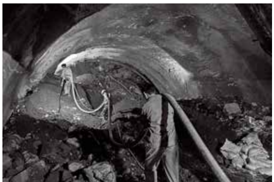
紧急处理塌方险情