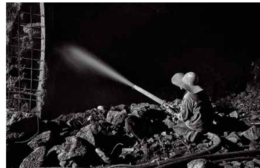
喷砂浆是最吃最脏的工作之一