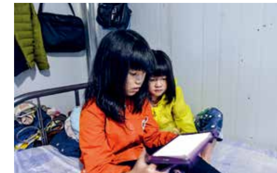
一家人团聚在工地