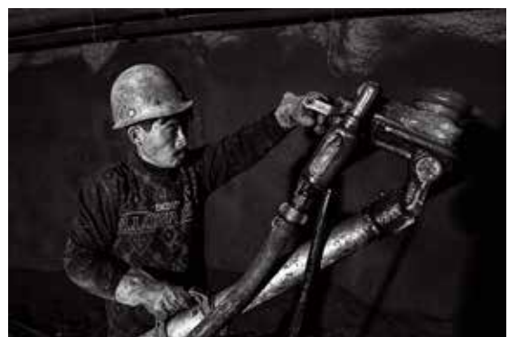
手持风镐进行钻孔

关注平凡的工作和平凡的生活，善于从平凡中提取生活的真谛，是一个纪实摄影师最核心的素质，也是我在今后的摄影创作道路上继续坚持和努力的方向。