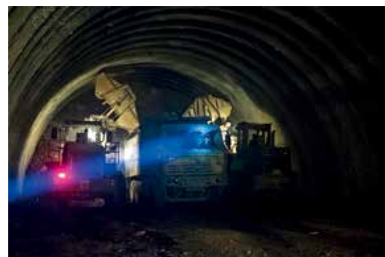
爆破炸下来的石渣被及时装车运出隧道