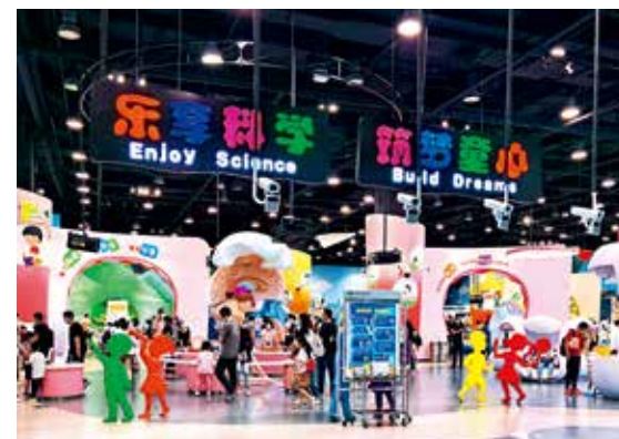
端午节期间，孩子们在家长的陪同下走进中国科技馆，探寻科技知识，丰富假日生活。