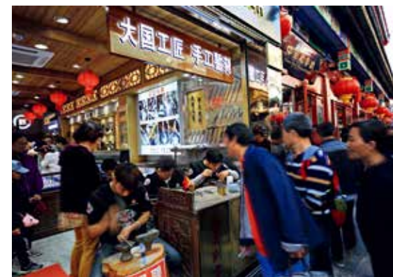
国庆70周年的大栅栏，手工篆刻吸引着游客的目光。传承非遗国之瑰宝，大国工匠国家基石。