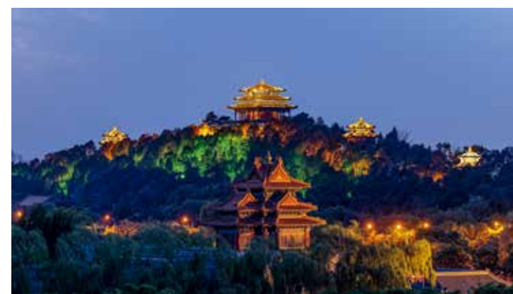
万春亭与角楼的对话