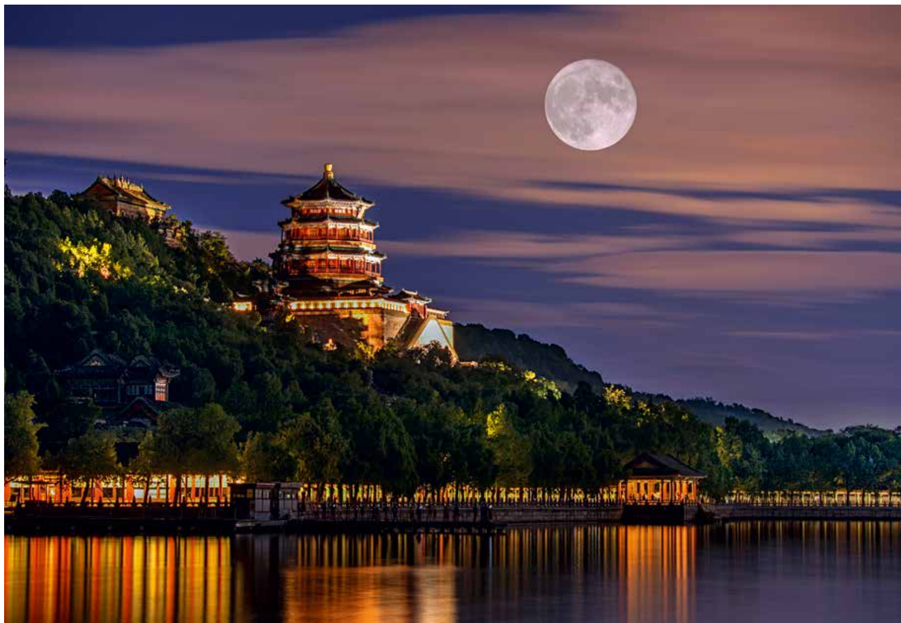
2021年中秋节之夜，颐和园西堤景色怡人，佛香阁在月光和灯光的交织下古色古香。此照片采用多重曝光拍摄。