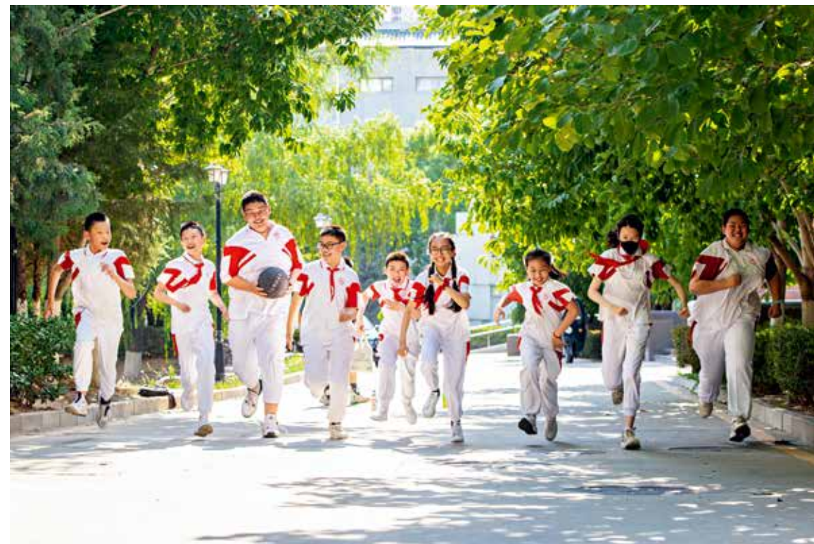
公园内，一群学生正在玩耍追逐，阳光洒满了孩子们的笑脸，阵阵笑声中充满着欢乐与朝气。