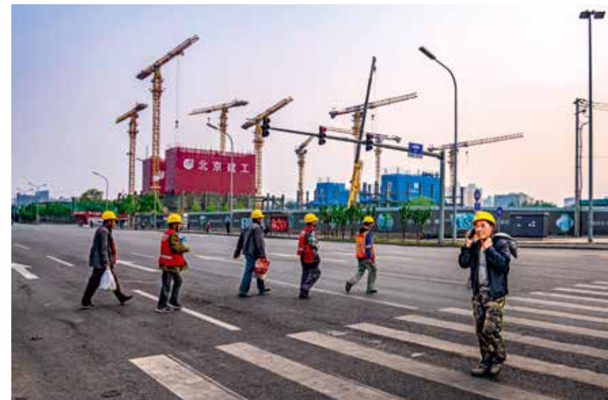
丽泽商务区建设工地，一位农民工兄弟下班路上接到家人的电话，听到了乡音后，脸上露出温暖幸福的笑容。