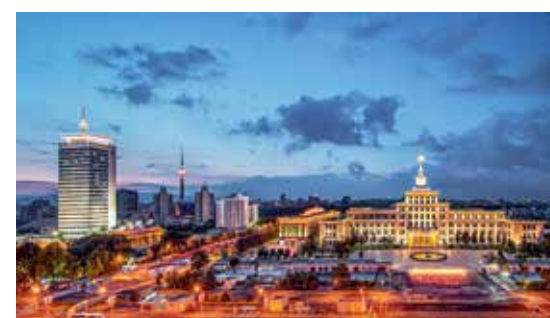
军事博物馆与电视塔遥相辉映