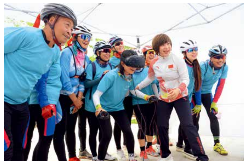
自由式滑雪空中技巧滑雪世界冠军郭丹丹、自由式轮滑世界冠军李植荣和石景山地区的学生、居民一起，参与石景山“魅力冬奥”系列活动启动仪式，大家正在现场体验VR滑雪模拟器。