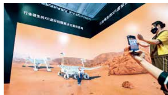
2021服贸会首钢园区内，一位小朋友正在体验XR虚拟拍摄，场景兼具沉浸感与临场感。