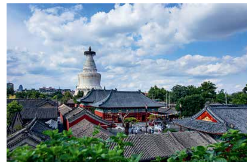
蓝天白云下的白塔寺