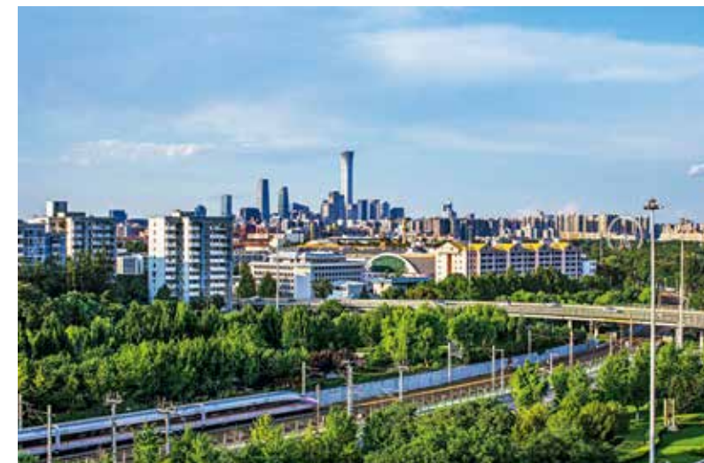
火车驶过现代都市