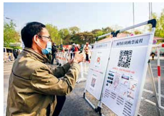
常态化疫情防控时期，玉渊潭公园外，市民正在预约扫码购票，安全快乐出行。