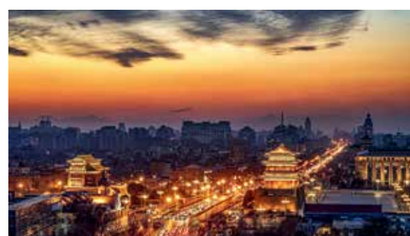
夕阳下的前门大街