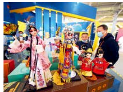
在2021服贸会首钢园区的文旅服务展馆内，各种北京题材的展品吸引着观众，浓浓的京味儿令人倍感亲切。