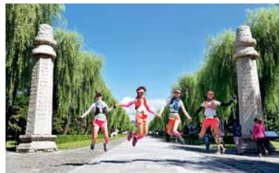
好时节，善行者们走进大自然，以饱满的情绪迎接挑战，一边欣赏沿途美景，一边锻炼健康体魄。