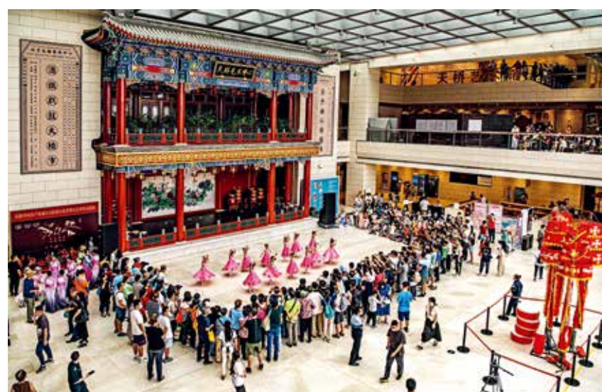
昔日的天桥是老北京平民汇聚的繁华之地，如今的天桥艺术中心已成为广大市民享受文化生活、陶冶艺术情操的热门场所！