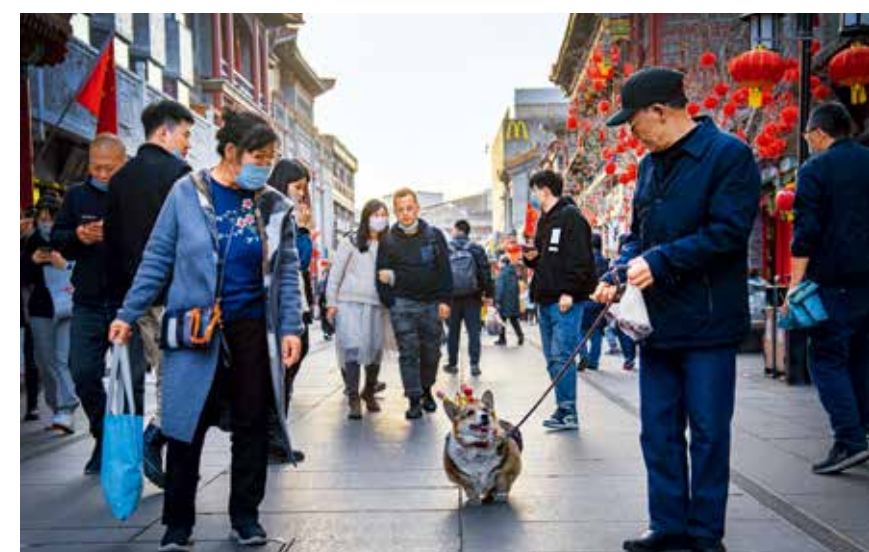
2021年春节，疫情防控常态化下的什刹海，一位老人与爱宠在街道上互动，引得游客纷纷投来探寻的目光。