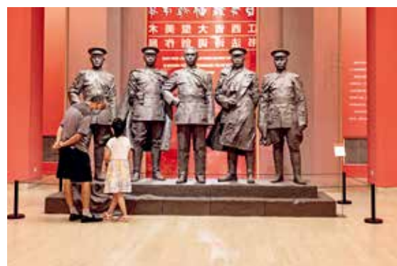
中国美术馆大厅中央，南昌起义五位主要领导人的塑像前，一位老人正在给孙女讲述南昌起义的历史，传承革命精神。