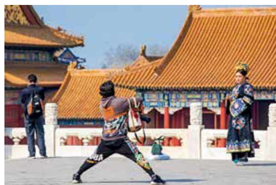
近年来，穿古装拍写真开始流行。汉服、清宫服装……不一而足，一位女士正在故宫里拍摄。