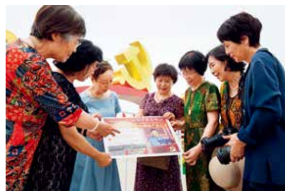
7月25日，首都群众喜迎中国共产党成立100周年，为中国全面建成小康社会欢欣鼓舞，在天安门广场留下百年盛事纪念照。