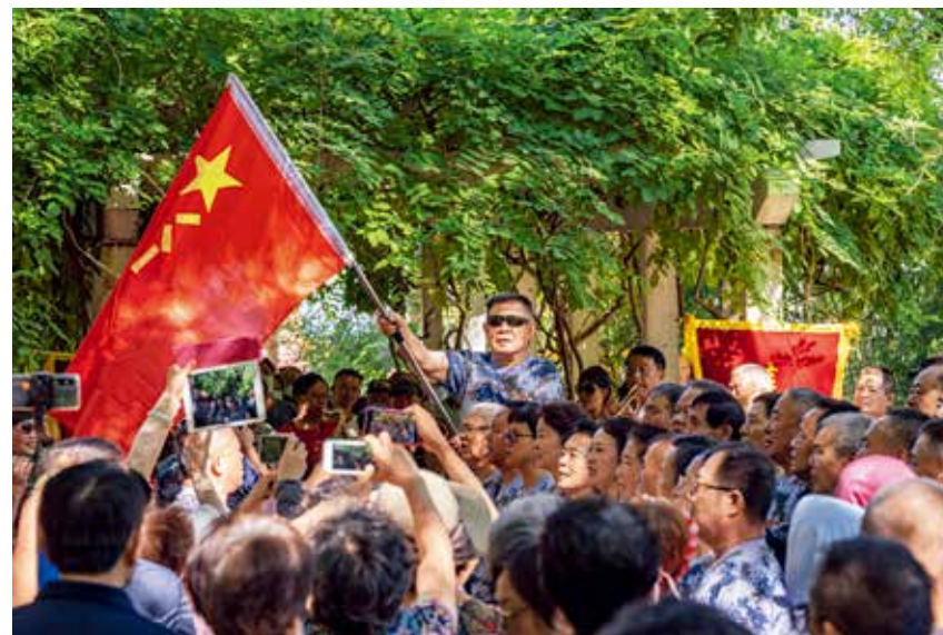
“八一”建军节，退役老兵身穿制服、佩戴军功章，面向军旗放声高歌，歌颂新时代，弘扬正能量。