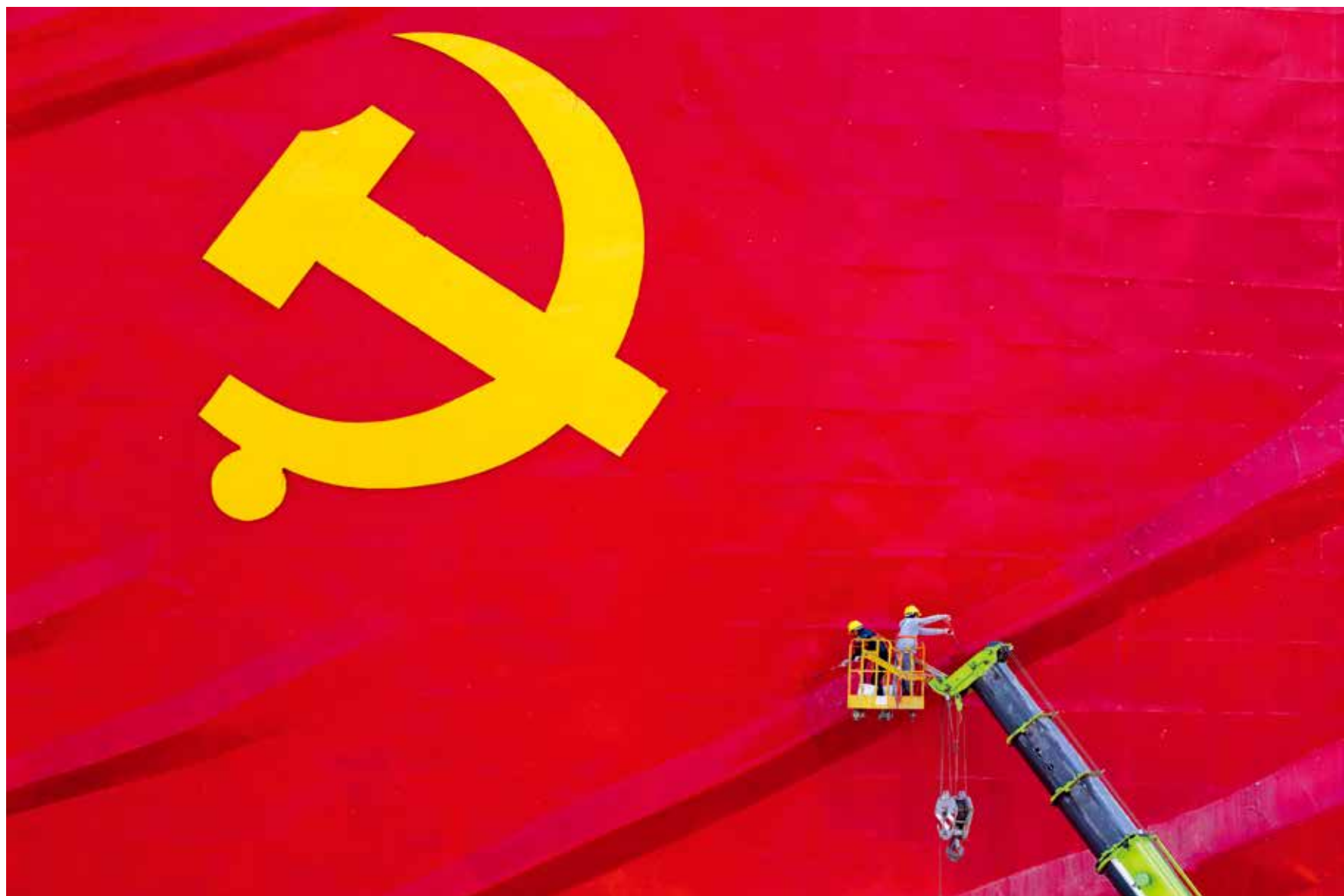
在中国共产党成立100周年之际，工人师傅在高空粉刷党旗，为党增辉。