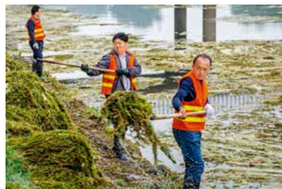
通州运河减河中，清洁工正在紧张地打捞水草。两名清洁工划船将河面上的水草推向岸边，再由岸上的清洁工打捞上岸。