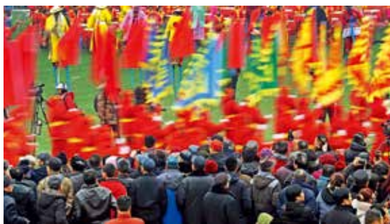
元宵民间花会巡游