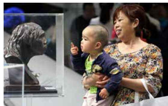
周口店北京人遗址博物馆内，一个小娃娃好奇地看着猿人雕像。