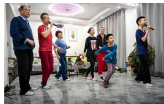
每个小家庭的和谐友爱，是整个社会的大和谐，逢年过节常聚常乐是增进亲情的最好方式。