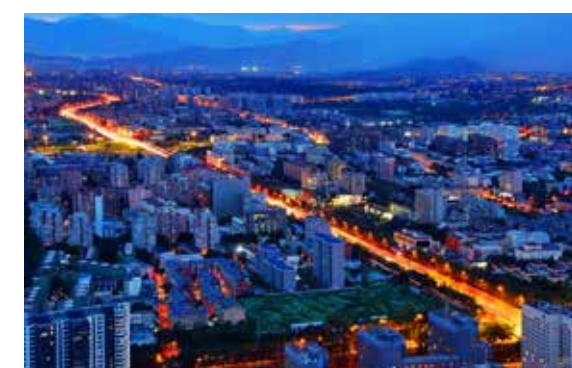
京西夜色美如画