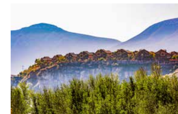
世外桃源