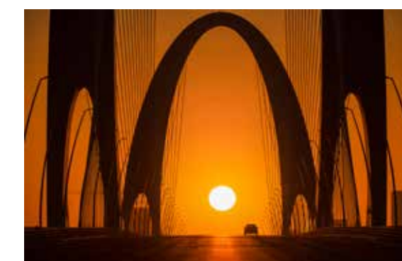
首钢桥悬日