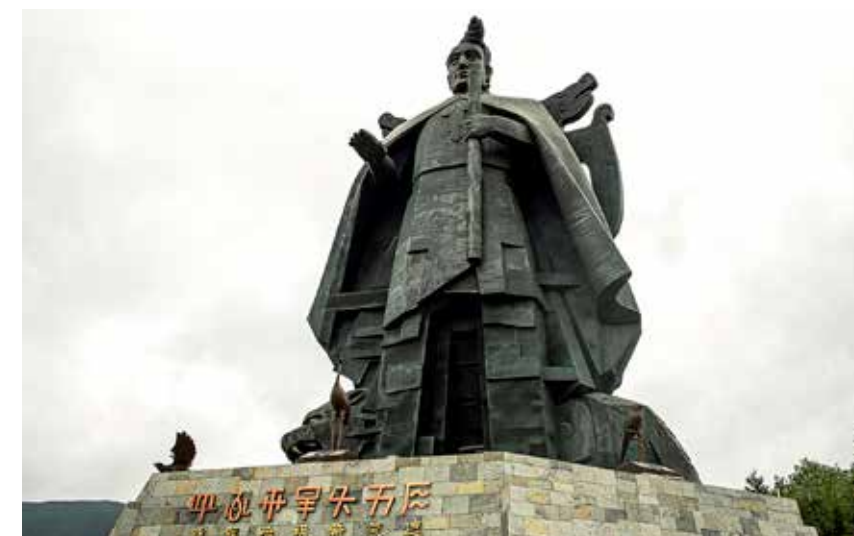
全国最大的彝族始祖希慕遮塑像