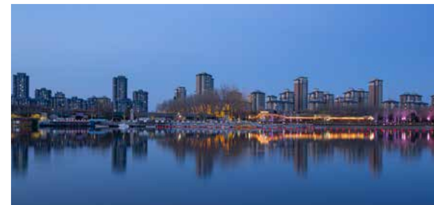
运河人家