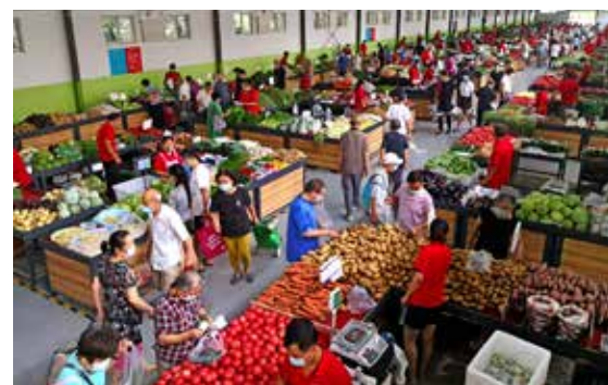
经过两年的修缮，会城门农贸市场于2020年重新开张。