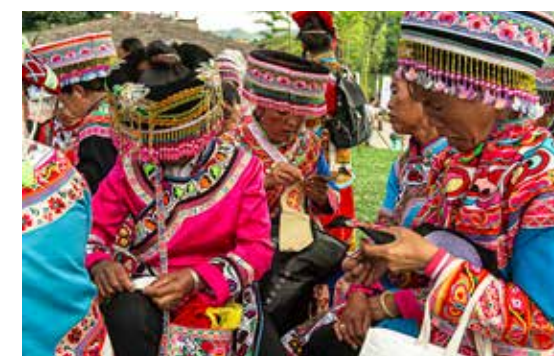
独具特色的彝族服饰