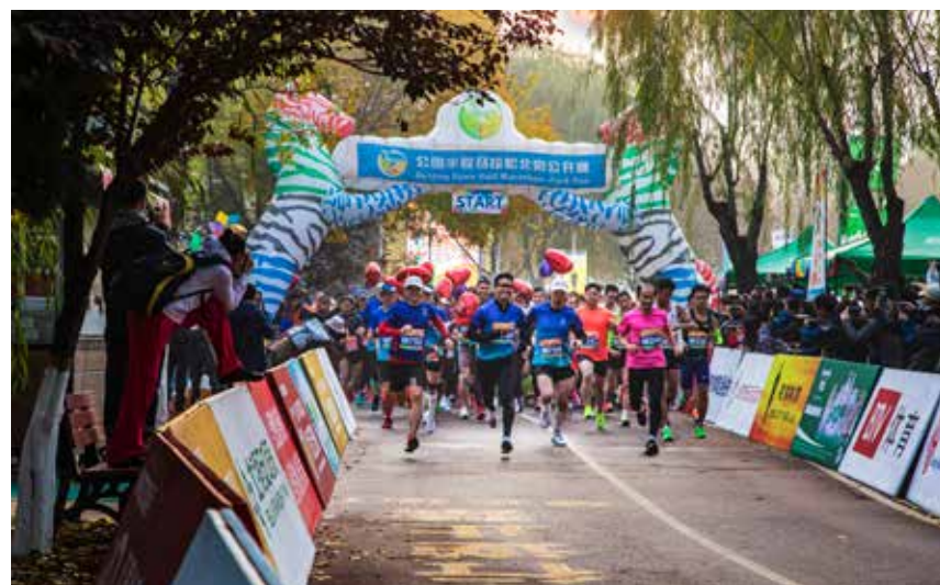
常营乡是北京著名的的体育之乡，一年一度的半程马拉松在常营公园已举办多年。