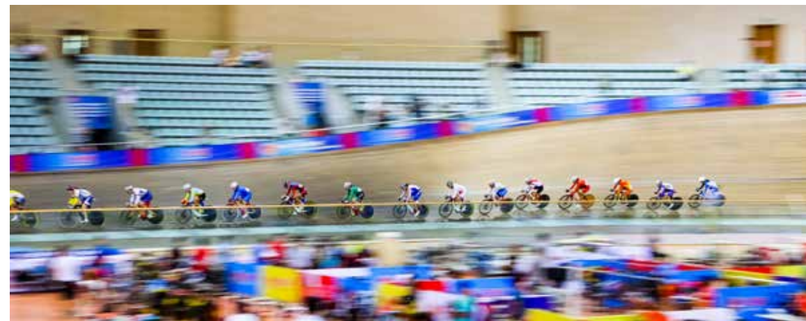
全国自行车场地赛共设男女争先、团体追逐、全能赛等14个项目，这是在北京老山自行车馆进行的团体竞速争中的一个瞬间。