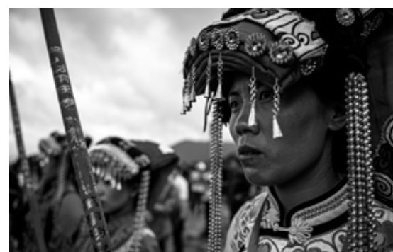
独具特色的彝族服饰