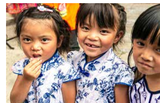
漂亮的彝族小姑娘