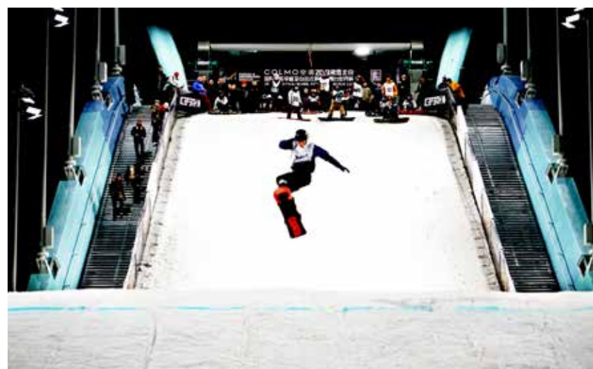
首钢产业园内，运动员正在进行高台速降训练。