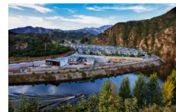
新农村风貌