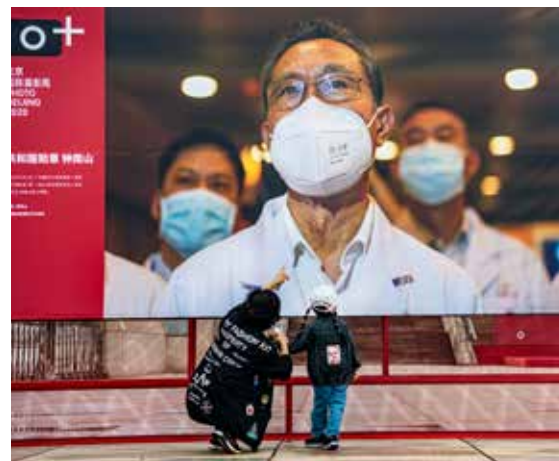
2020年抗疫宣传展上，一位老人正在给孙女讲述英雄故事。