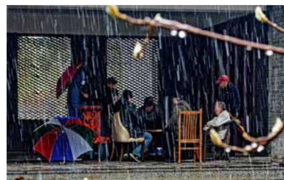
雪中，市民在右安门外街心花园休闲娱乐，悠闲地享受生活。