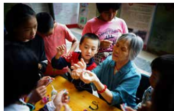
孩子们现场体验非遗项目，感受非遗的无穷魅力。