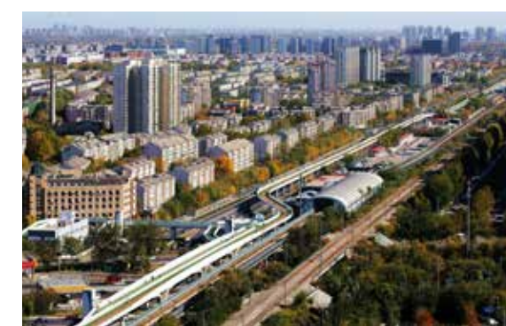
回天新貌