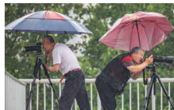
突然下起了瓢泼大雨，两个摄影人不顾风雨，一个向东拍摄一个向西拍摄。