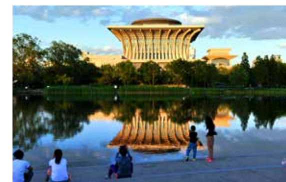
北京新景观