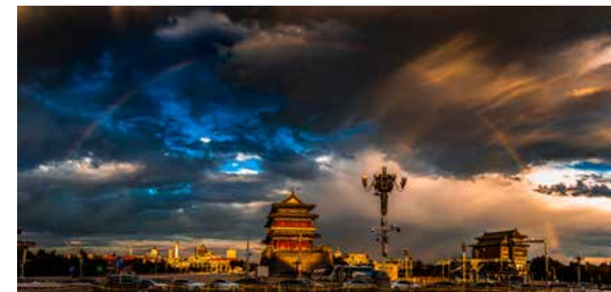
京城中轴线上架起彩虹桥

拥有3000多年建城史的北京，历经岁月洗礼与时代变迁，始终保持着东方魅力与发展活力。在中国社会科学院（财经院）与联合国人居署共同发布的《全球城市竞争力报告2019-2020：跨入城市的世界300年变局》中，基于全球城市的经济竞争力、可持续发展竞争力、城市评级等方面，北京入围全球二十强。蓬勃发展的北京，不仅彰显了现代都市的繁华，也表现出了人居环境的情趣与温情。随着北京中轴线申遗工作的不断推进，北京将被更多人了解与关注。