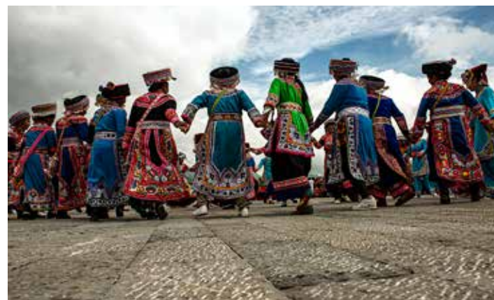
大型原生态歌舞表演