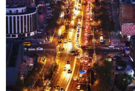
车水马龙