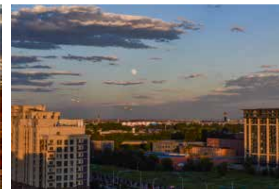
京郊巨变 (组图)