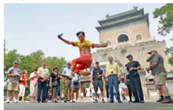
钟鼓楼广场，京城民间绝技“踢毽儿”成为一景。