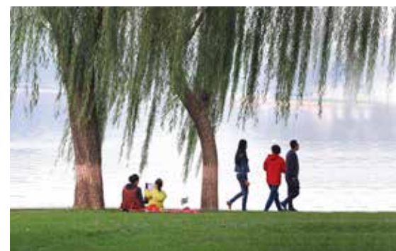
午后龙潭湖，一位妈妈陪着女儿静静地河边作画，游人来往穿梭，构成了一幅美好的生活画卷。