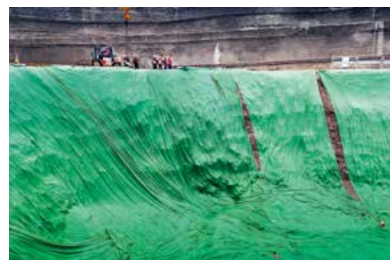
文明施工 绿色相伴

边区域的城市化发展，与现有车站深度融合，优化首都交通运输结构，并为雄安新区建设提供有力保障。