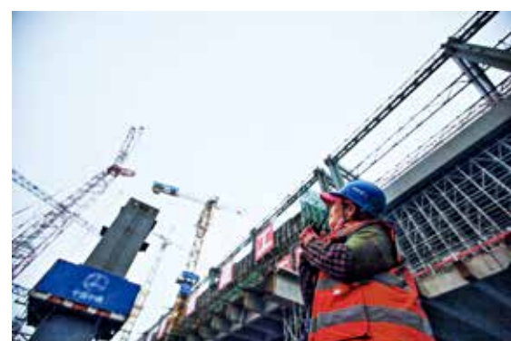
工地交响乐