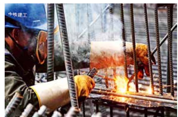
如花绽放

北京城市发展日新月异，离不开高层设计的智慧付出，也离不开建设者们的辛勤劳作。和平年代，他们就是我们身边最可爱的人。按照规划，丰台站将于2021年年底开通运营，让我们共同期待丰台站的涅槃重生和下一个百年辉煌！