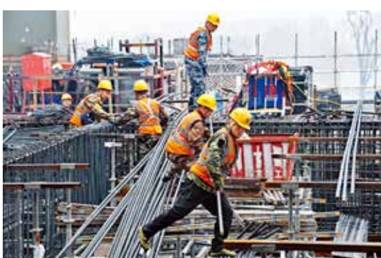
齐心协力