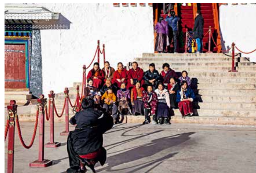
布达拉宫殿门口的全家福

朝拜，是藏族民众一生中最重要的事情。相信来到藏地的朋友不仅为藏区的风景所吸引，更为藏族的虔诚信仰所感染。作为一个无宗教信仰的人，