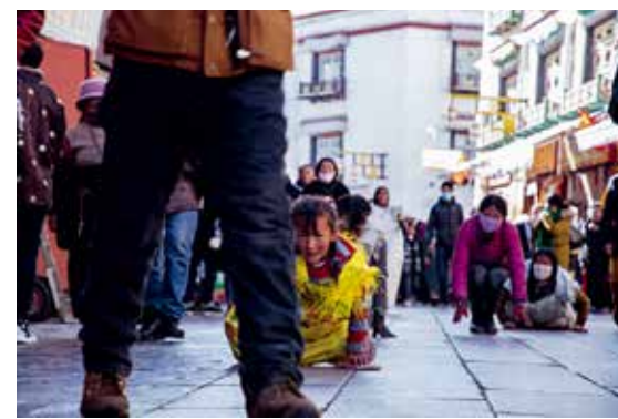
朝拜中的小女孩儿