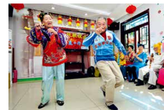
社区里快乐的人们