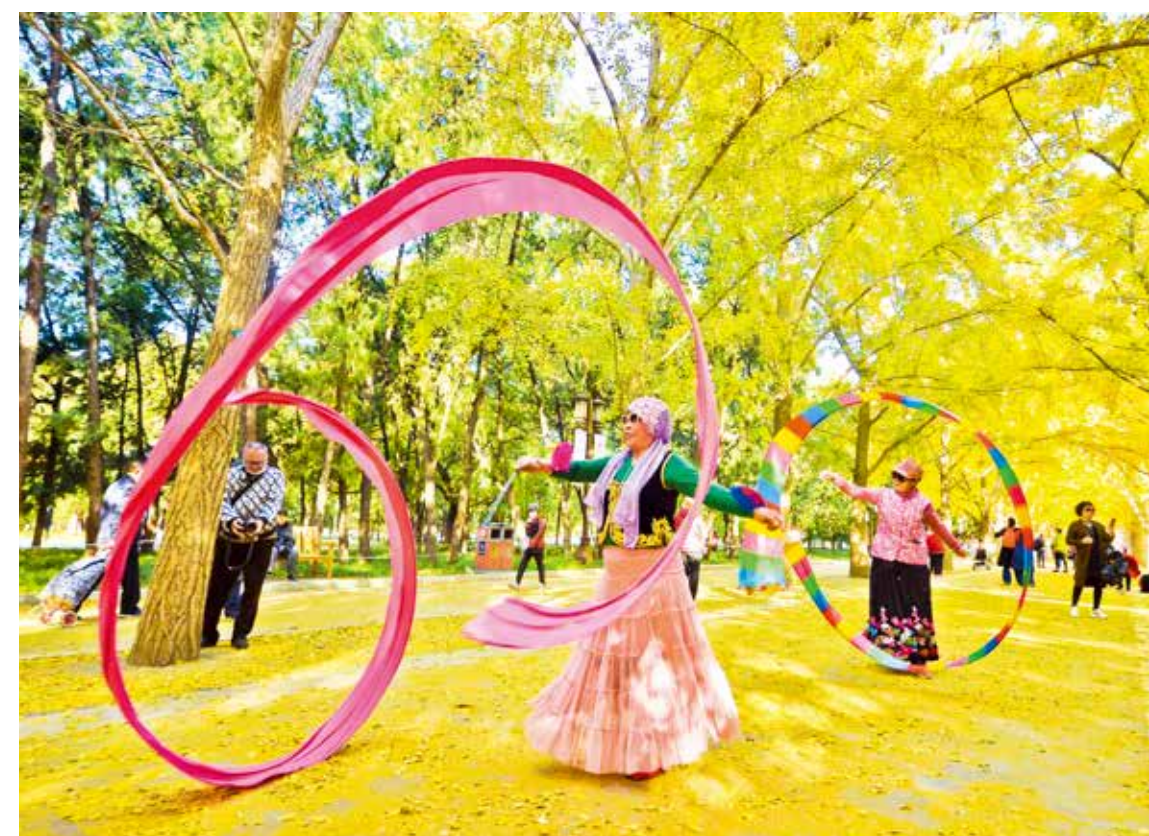
舞在金秋

在努力建设成为国际一流的和谐宜居之都的进程中，首都北京飞速发展，城市建设日新月异。北京取得的发展成就，除了我们目所能及的城市变化之外，也体现在了首都市民的日常生活之中。四季更迭，光阴流转。勤于奋斗、乐享生活的首都市民，在首都摄影爱好者的镜头中组成了一幅流动的生活画卷。丰富多彩的文化生活、老有所乐的晚年时光、妙趣横生的节庆假日、充满温情的亲子互动，解锁了幸福生活的多重模式。