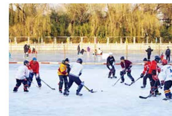
全民运动