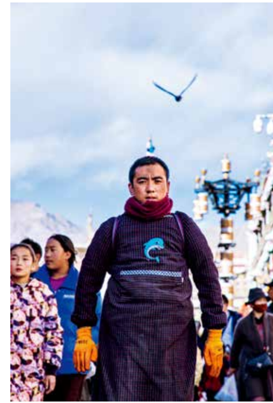
前来朝拜的色达佛学院僧人