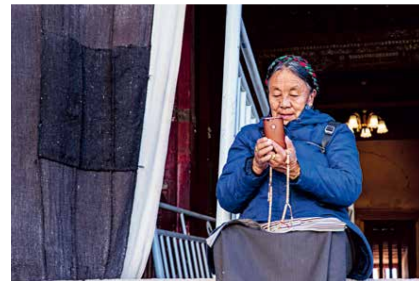
坐在布达拉宫的台阶上，与家人互相问候新年快乐