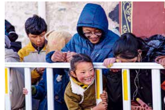
节日里，孩子们显得格外快乐