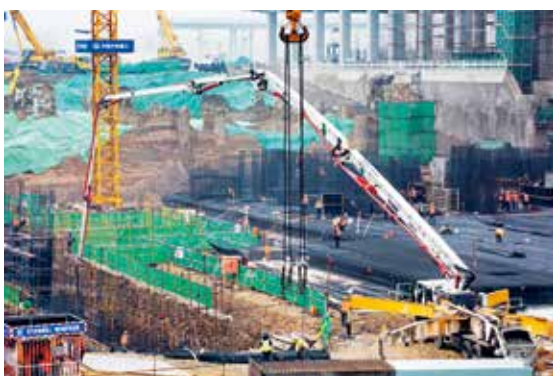
日新月异的丰台站

截至2020年9月，丰台站的站场规模为17台32线，途径铁路线路包括京沪铁路、京广铁路、丰沙铁路、京原铁路、丰广联络线、京港高速铁路。基于“北京铁路枢纽七大主站之一”的定位，改造后的丰台站将分流北京西站的过度聚集，带动周