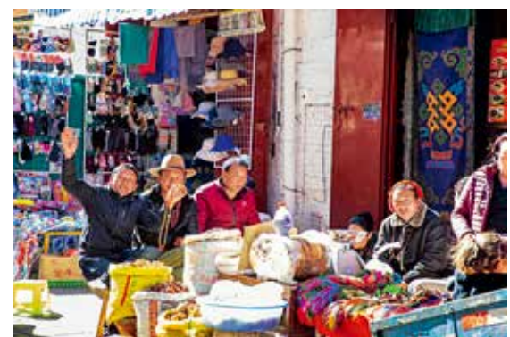
在镜头里看见回应的笑脸，心里泛起一股暖意