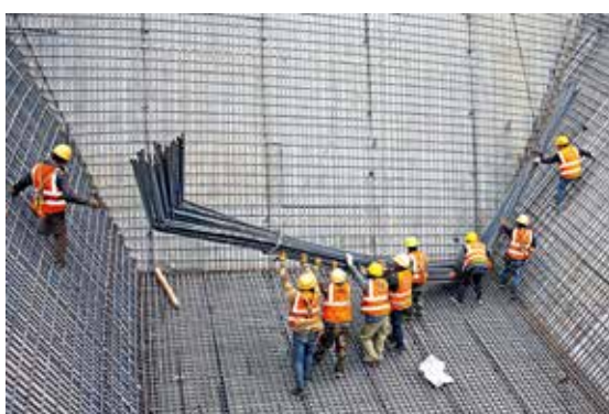
繁忙工地一瞥