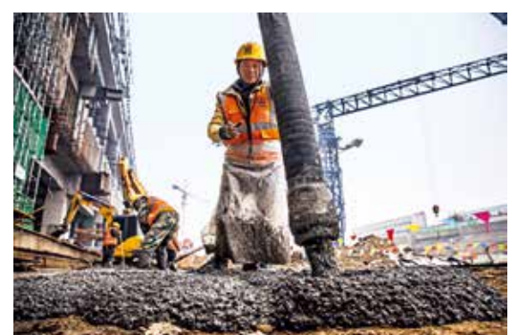
水泥浇筑工