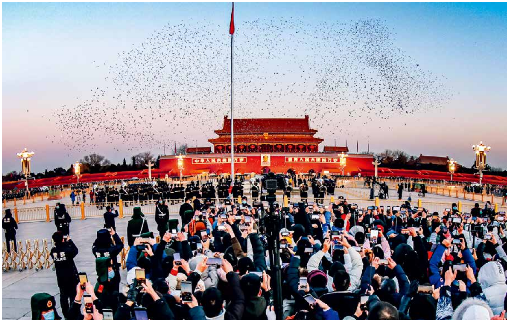
2021年元旦清晨，市民和游客齐聚天安门广场，共同观看新年首场隆重的升国旗仪式。上千只和平鸽飞向天空，场面壮丽，为新年带来新的希望。