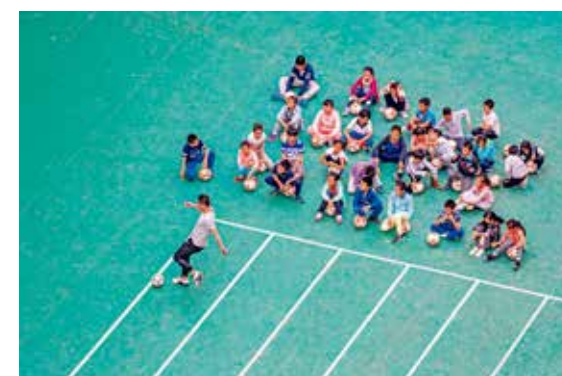
射门示范