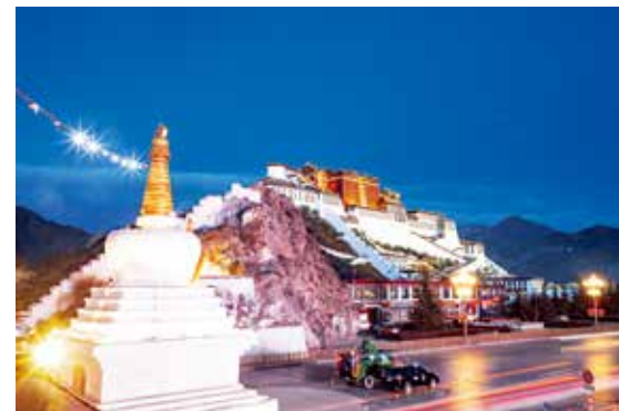
夜幕下的布达拉宫

在朝拜的人群中，有一个小女孩儿目光里透着坚毅，身后都是她的家人，她是家庭里朝拜最起劲儿的一位。还有来自色达佛学院的僧人、拄着拐杖步履蹒跚的老人……人们虔诚的举动，无时无刻不感染着我这个外乡客。