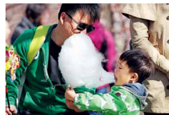
好大的棉花糖