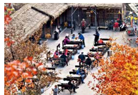
秋到农家院