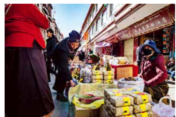
琳琅满目的集市街头

2019年的藏历新年和农历新年是同一天。新年前夕，走在冲赛康的集市街头，热闹非凡。街道两旁的摊位琳琅满目，四面八方的藏民纷纷前来汇聚于此，置办年货。