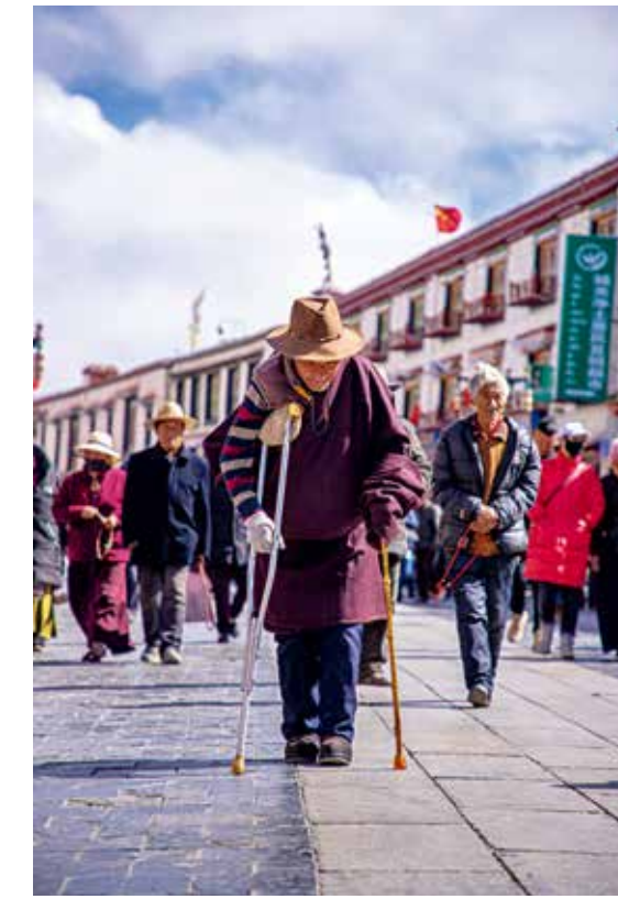
虔诚的信仰，感染着我这个外乡客

另一个藏族小女孩儿回答了我刚才的疑问。她是那曲地区的，在西安上大学，和她的相识是因为她问我相机应该怎样设置，我们一起拍了一个多小时。她说：“我们从小就这样，会走了，就开始朝拜，这是一件很平常的事情。同时因为习惯了，所以也不觉得累。”她回答时语气很平和，面带笑容。