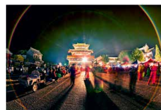
古城欢舞 (裴桐年/摄)